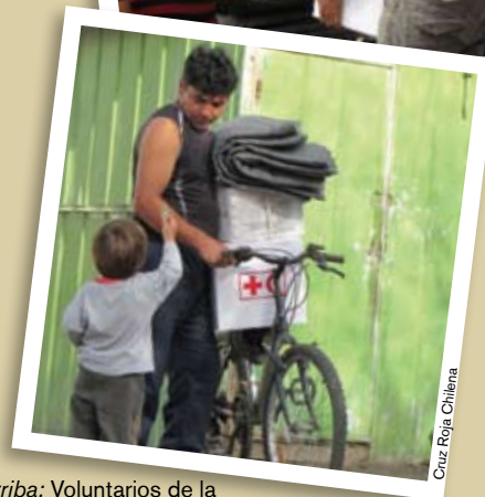
Arriba: Voluntarios de la Cruz Roja Chilena distribuyen suministros de socorro a sobrevivientes del desastre. Abajo: Un sobreviviente lleva suministros a su casa.