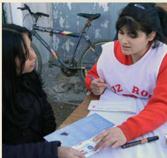
Una asistente social de la Cruz Roja Chilena entrega una Tarjeta Roja a una sobreviviente del terremoto.

En estos momentos, a través del novedoso programa “Tarjeta Roja”, la Cruz Roja ayuda a la gente a realizar mejoras o reparaciones entregando tarjetas de débito que brindan asistencia a unas 42.000 personas. Estas tarjetas permiten a las familias comprar herramientas y materiales por un valor de hasta $350 en ferreterías seleccionadas de todo el país. Hasta hoy, se han distribuido tarjetas a más de 5.000 familias.